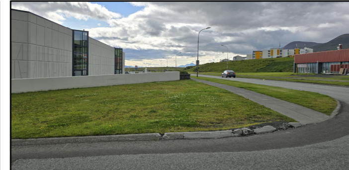
ÁSYND - EFTIR BREYTINGU Á FRUMHÖNNUNARSTIGI