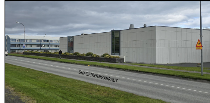
GÖTUSÝN FRÁ HEGRABRAUT - FYRIR BREYTINGU