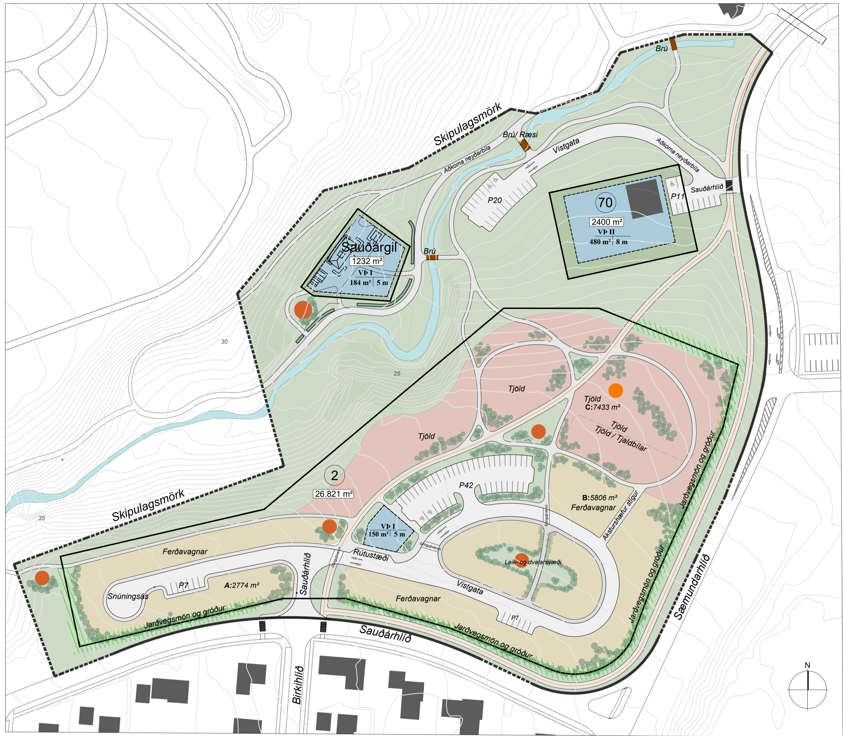
Skipulagsuppráttur m.k.v. 1:1000 Kortagrunnur Skagafjarðar: ISN93