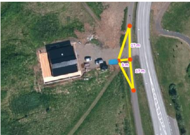
MYND 4 Sjónlengdir við útkeyrslu, gagnvart umferð á gönguleið.