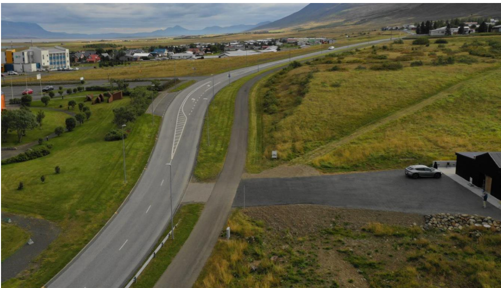
MYND 2 Nýleg flygildamynd af Sæmundarhlíð við innkeyrsluna að Sauðárhlíð. Horft til suðurs.

Eins og staðan er í dag hefur kantsteinn verið lækkaður og hellulögð innkeyrsla verið mótuð sem þverar gönguleiðina í plani. Innan gönguleiðarinnar hafa verið lagðar malarfylltar jarðvegsgrindur upp að húsinu, þar sem einnig hefur verið sett upp skilti fyrir bílastæði hreyfihamlaðra.