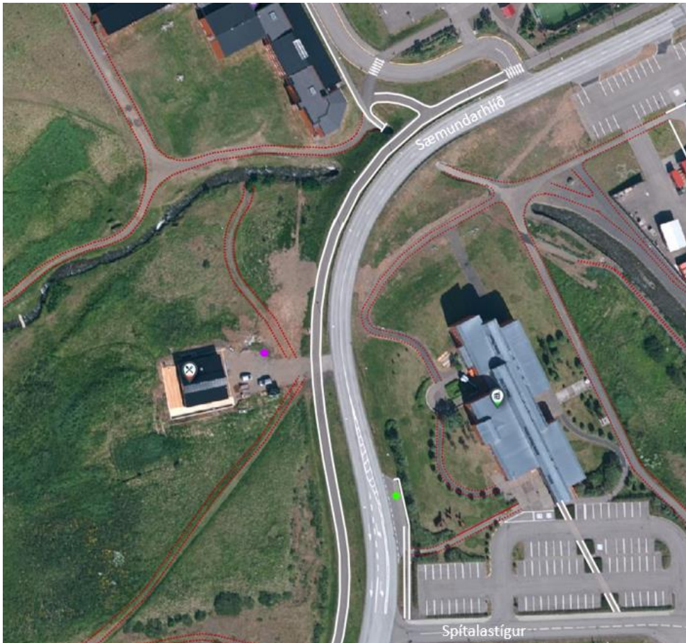
MYND 1 Loftmynd af svæðinu. Gangstéttar og göngustígar eru afmarkaðir af hvítum og rauðum línun.

Eins og staðan er í dag hefur kantsteinn verið lækkaður og hellulögð innkeyrsla verið mótuð sem þverar gönguleiðina í plani. Innan gönguleiðarinnar hafa verið lagðar malarfylltar jarðvegsgrindur upp að húsinu, þar sem einnig hefur verið sett upp skilti fyrir bílastæði hreyfihamlaðra.