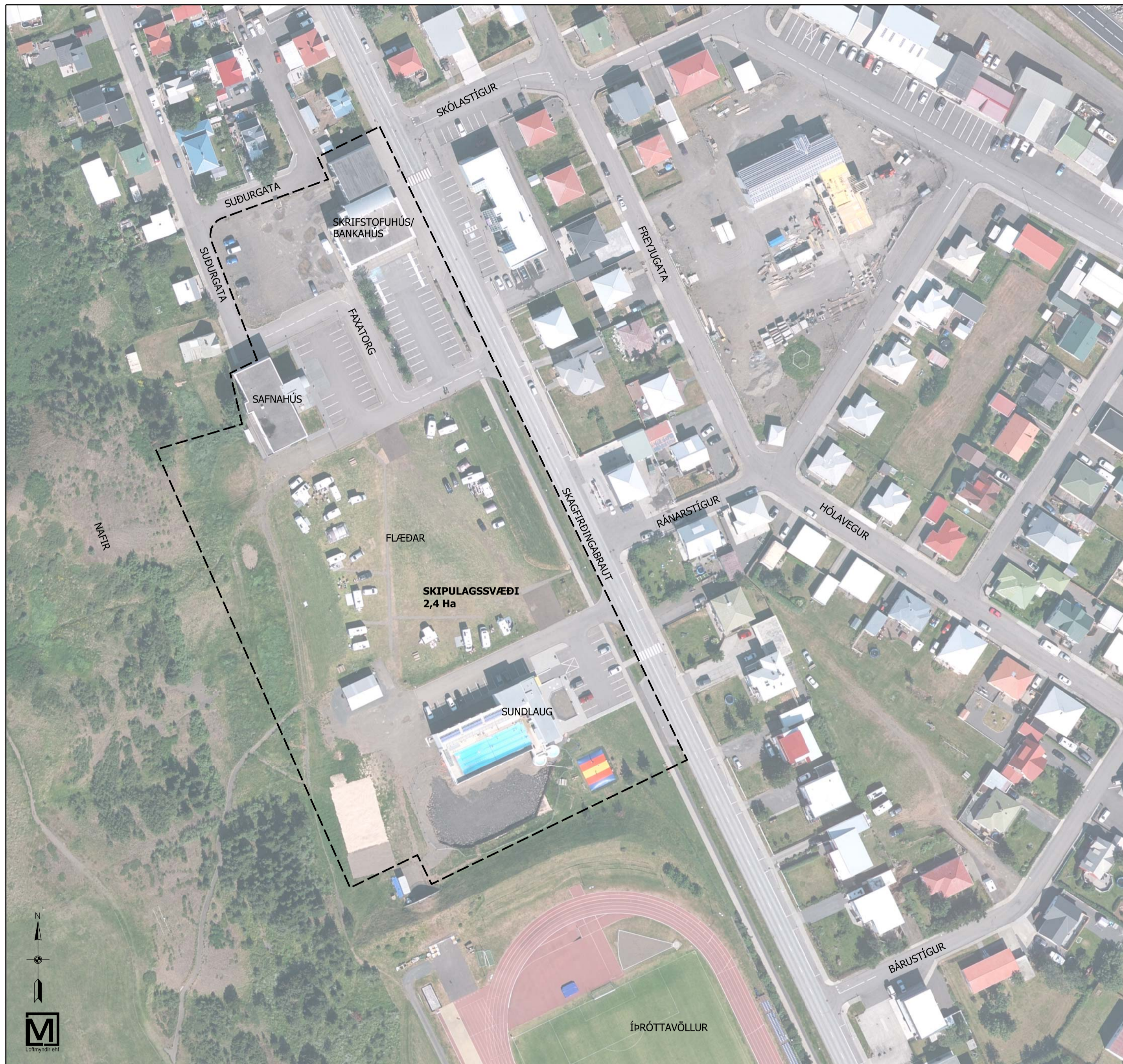
YFIRLITSMYND - Fyrirhugað skipulagssvæði Mkv. 1:1000