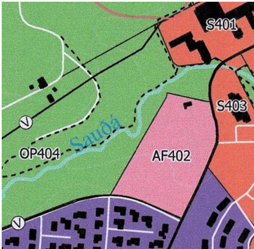
Mynd 2-1 Hluti þéttbýlisuppráttar Sauðárkróks, svæði AF402.

Aðalskipulag Sveitarfélagsins Skagafjarðar 2020 – 2035 var staðfest 4. apríl 2022. Fyrirhuguð breyting tekur til afþreyingar- og ferðamannasvæðis AF-402 og nær inn á aðliggjandi opið svæði OP-404.