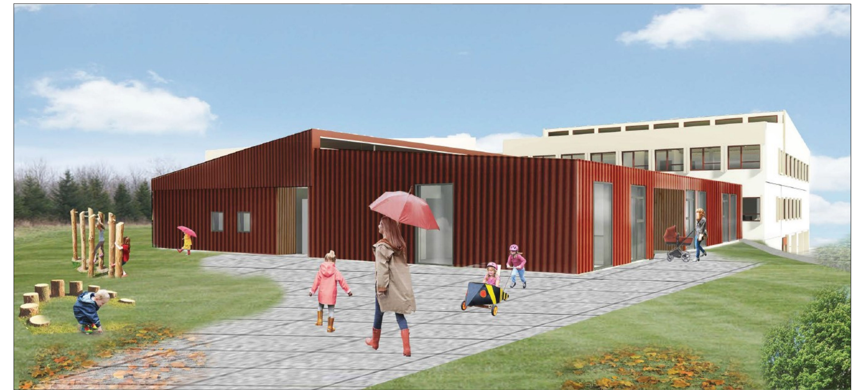
HORFT Í NORÐURÁTT AÐ INNGANGI FYRIRHUGAÐS LEIKSKÓLA