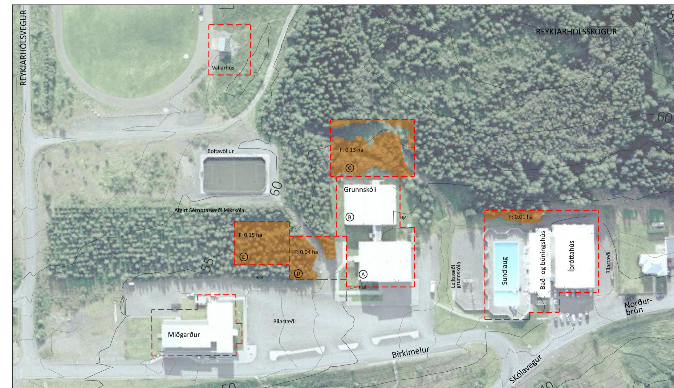
Nauðsynleg trjáfelling fyrir fyrirhugaðar byggingar er um 0,28 ha að flatarmáli