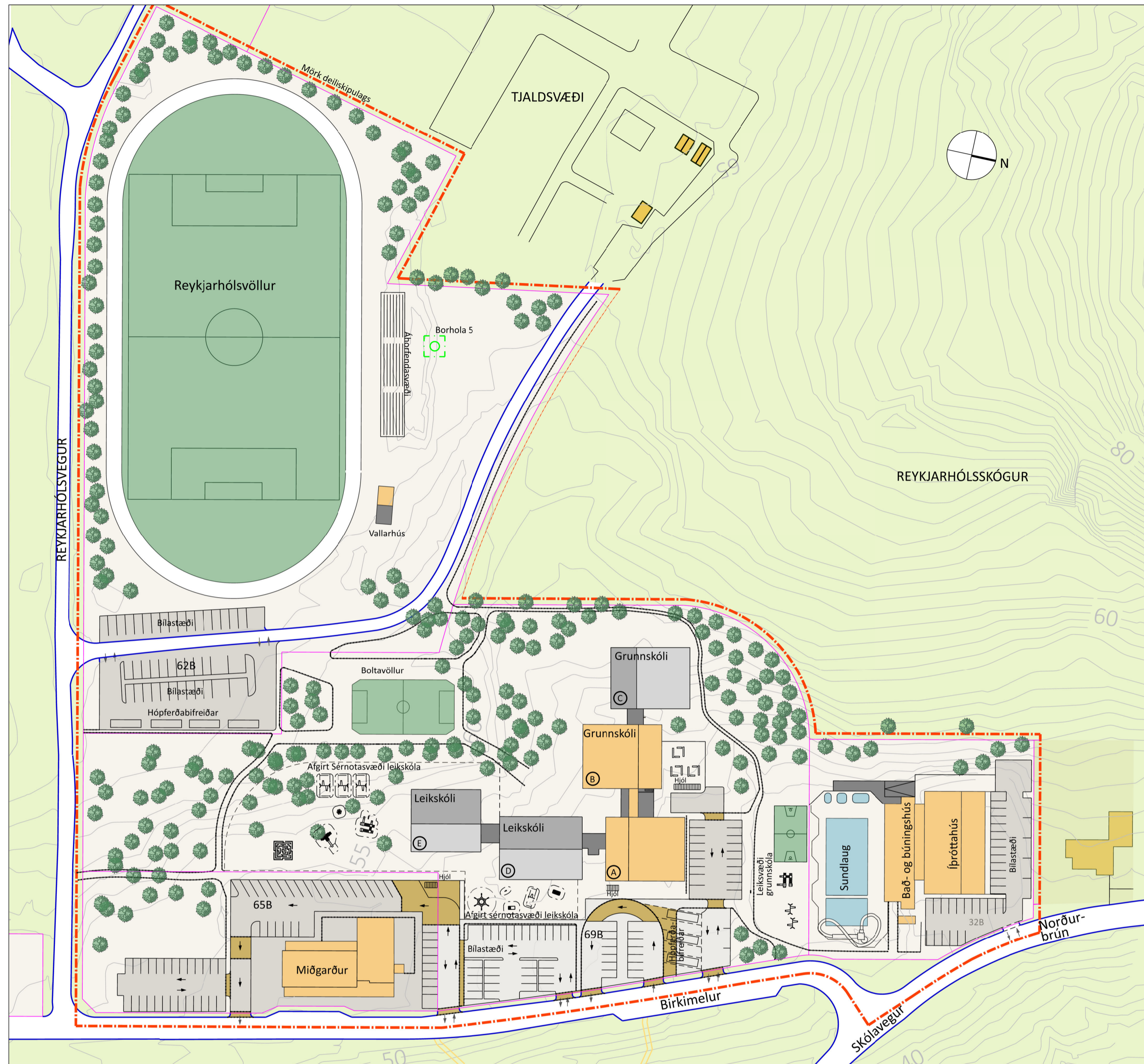
AFSTÖÐUMYND ER SÝNIR DÆMI UM MÖGULEGT FYRIRKOMULAG MKV 1:1000