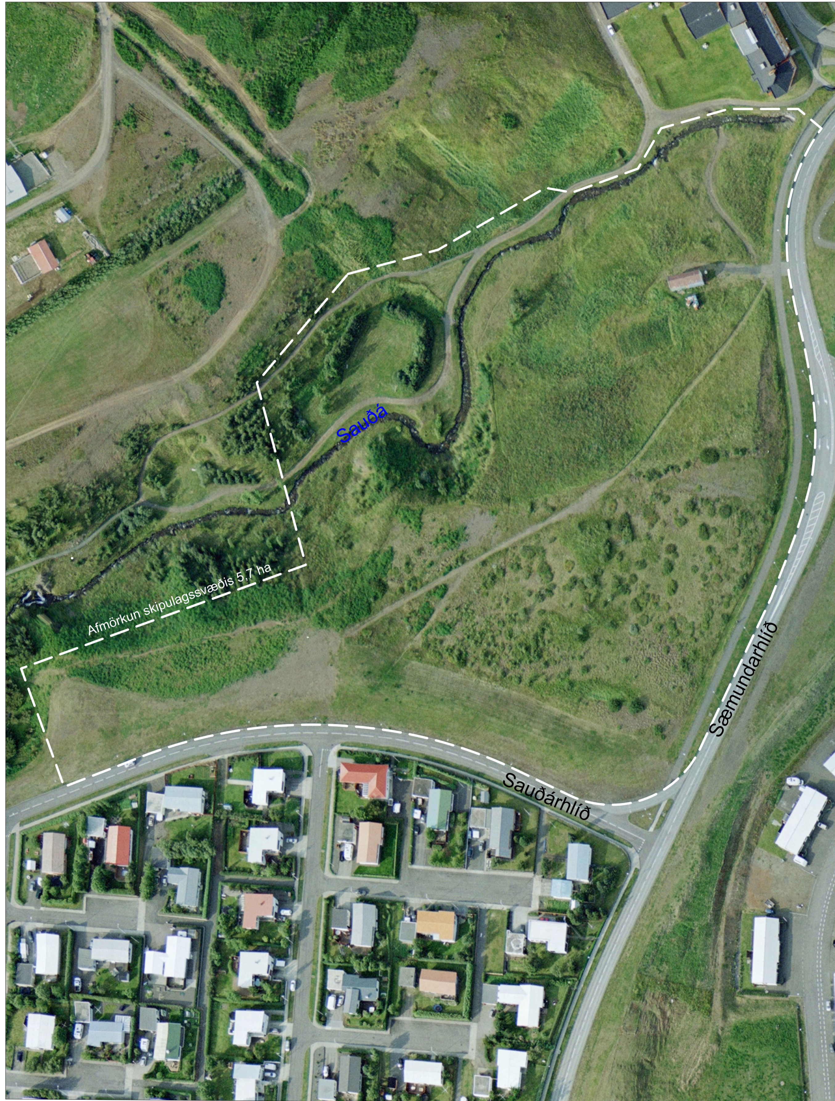
Afmörkun skipulagssvæðis 5,7 ha