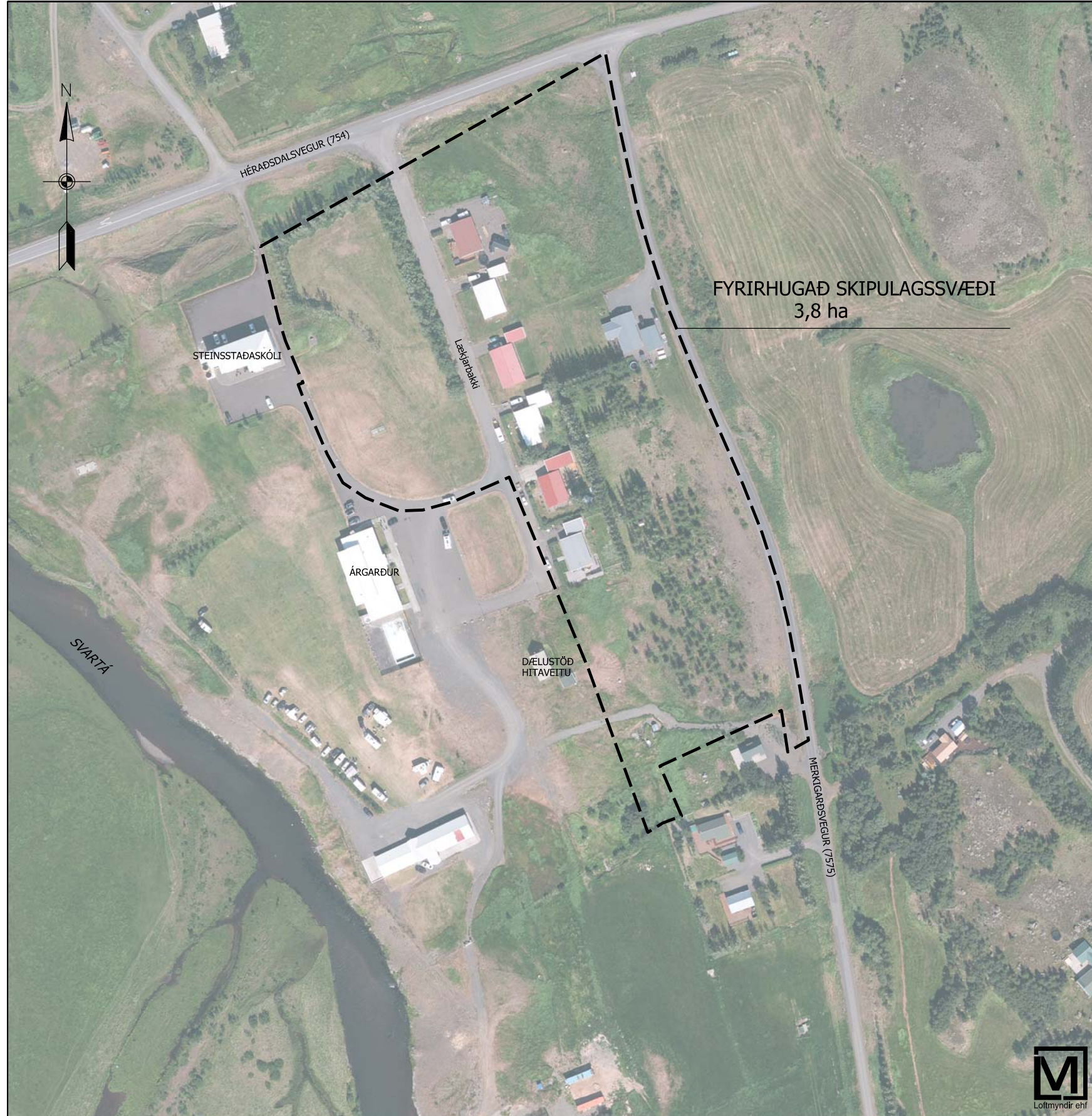
YFIRLITSMYND: FYRIRHUGAÐ SKIPULAGSSVÆÐI mkv. 1:2.000