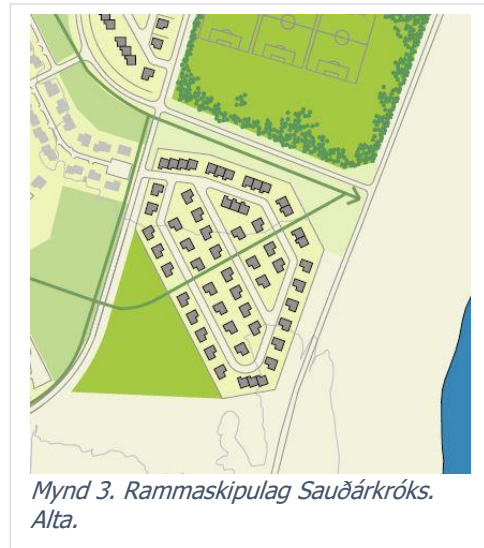
Mynd 3. Rammskipulag Sauðárkróks. Alta.

Lítill sem engin hætta er á ofanflóðum á Sauðárkróki. Þá er skipulagssvæðið utan áætlaðs flóðasvæðið skv. hættumati vatnasviða Héraðsvatna, unnið af Veðurstofu Íslands 4 .