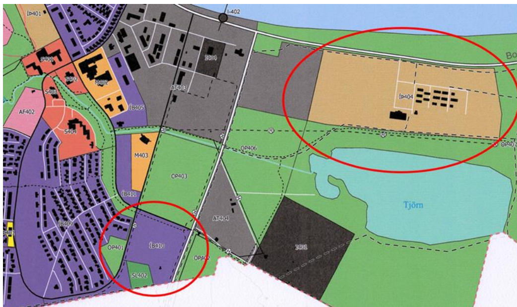
Mynd 2-1 Svæði fyrirhugaðra breytinga á þéttbýlisupprætti Sauðarkróks í Aðalskipulags Skagafjarðar 2020-2035